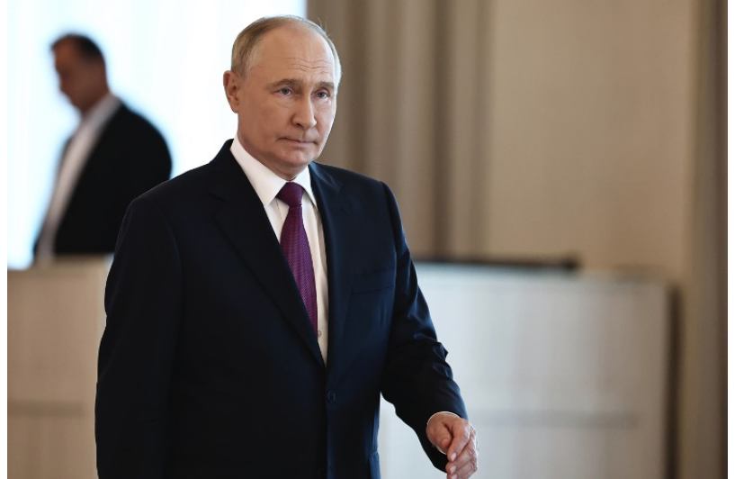
Vladimir Putin

Russian President Vladimir Putin signed a decree today allowing foreign citizens who oppose “destructive neoliberal ideological guidelines” the ability to apply for residency in Russia. The decree also authorizes the Russian Ministry of Foreign Affairs to create a list of foreign states they believe promote ideology that conflicts with traditional Russian spiritual and moral values: